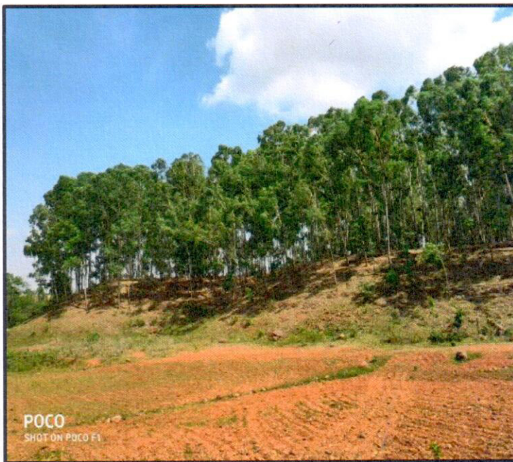
View of one small old inactive OB dump stabilized by vegetation with suitable native species at Kudag Lease

Rupam... Agent of Mines Sama Mines Division Hindalco Industries Ltd