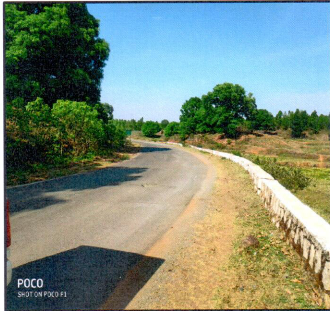
View of Black top road constructed up to pit head to reduce dust problem.

Rupam... Agent of Mines Barrick Mines Division Hindalco Industries Ltd